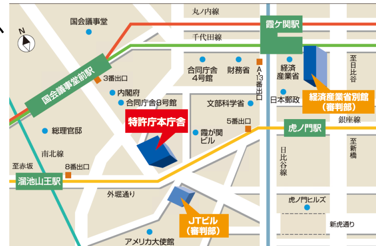
(図) 特許庁本庁舎周辺図