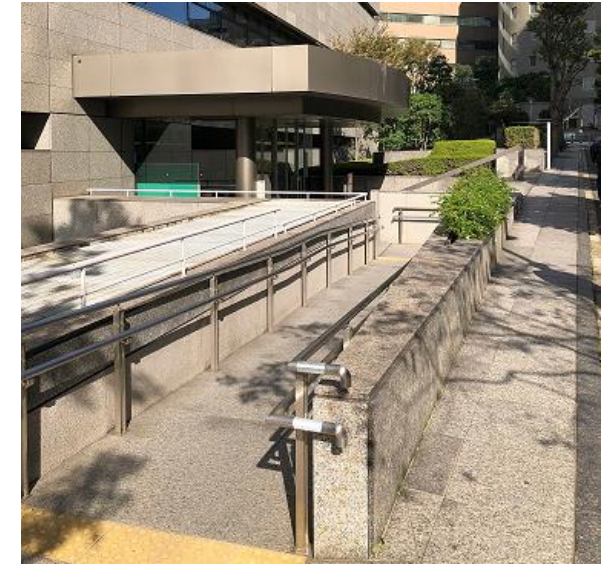
(写真) 特許庁本庁舎東口出入口