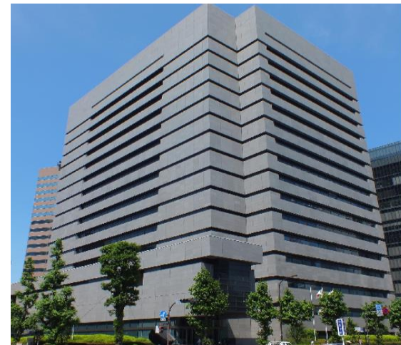
(写真) 特許庁本庁舎

□ 新しい機械や薬のような発明、バイクの形のようなデザイン、会社や商品の名前を表す商標を守るため、3,000名を超える職員が働いています。