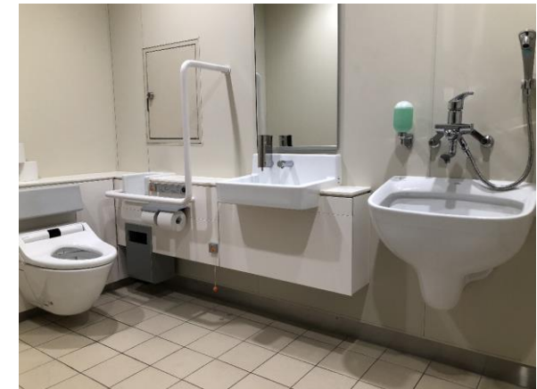
(写真) 多機能トイレ (特許庁本庁舎 1階)