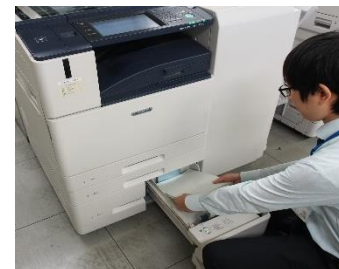
コピー用紙の補充