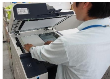
会議資料のコピー