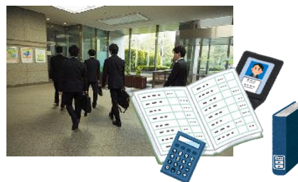
事件審査業務に必要な資料の作成・管理 など