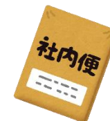
郵便物の 仕分け など