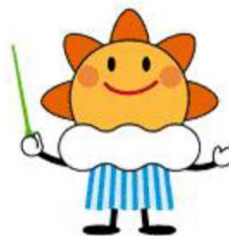
気象庁マスコットキャラクター 「はれるん」