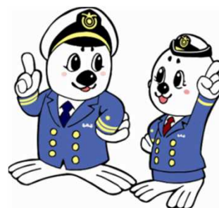
「うみまる」と「うーみん」